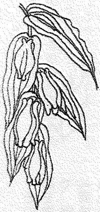
シヨウロホトマズ