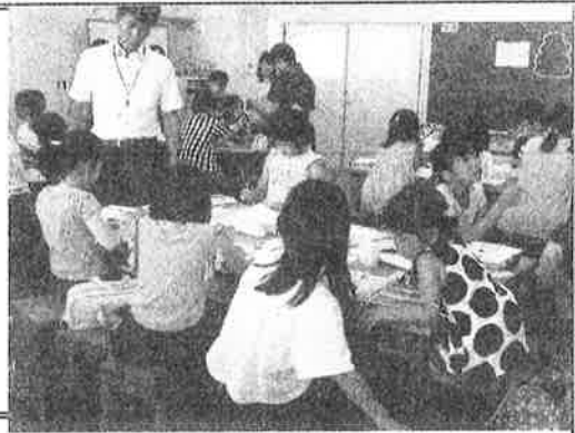
【昨年の教室の様子】